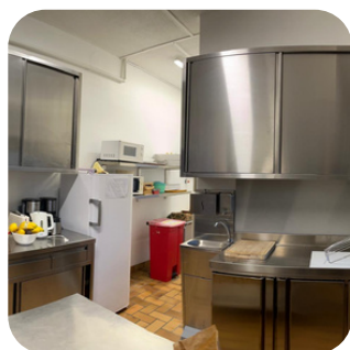
La cuisine du chalet a fait peau neuve !